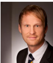
Jens Bonnekesel TEUPEN Maschinenbau GmbH